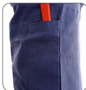
boční kapsa side pocket kieszonka boczna