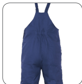
zadní strana back side odrotna strona