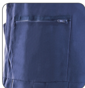
náprsní kapsa chest pocket kieszeń na piersi